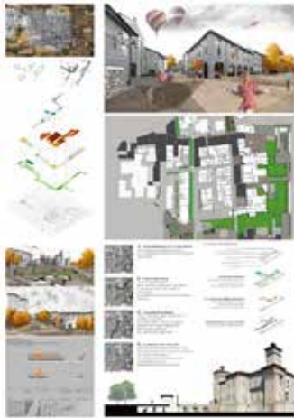
Nelle foto: i cinque progetti finalisti

Sono cinque i progetti che accedono alla seconda fase del concorso di idee indetto dal Comune di Soliera per riqualificare il proprio centro storico. Dei venti dossier arrivati da tutt'Italia (uno anche dal Portogallo) ed esposti dal 10 al 13 settembre scorso per una presa